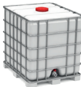
Container IBC de 1000 litres